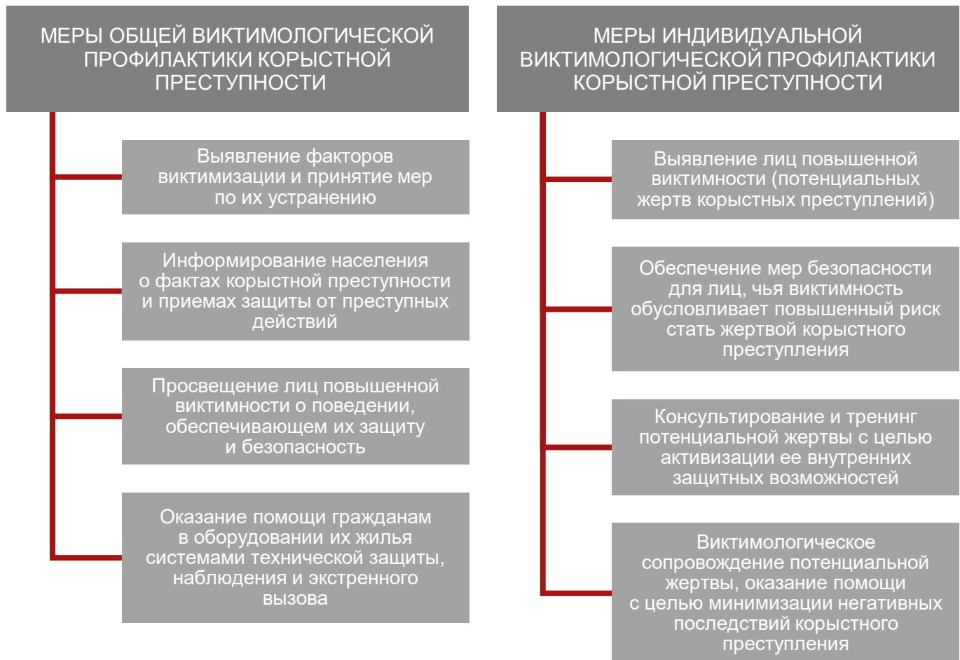
Схема 1. Уровни мер виктимологической профилактики корыстной преступности