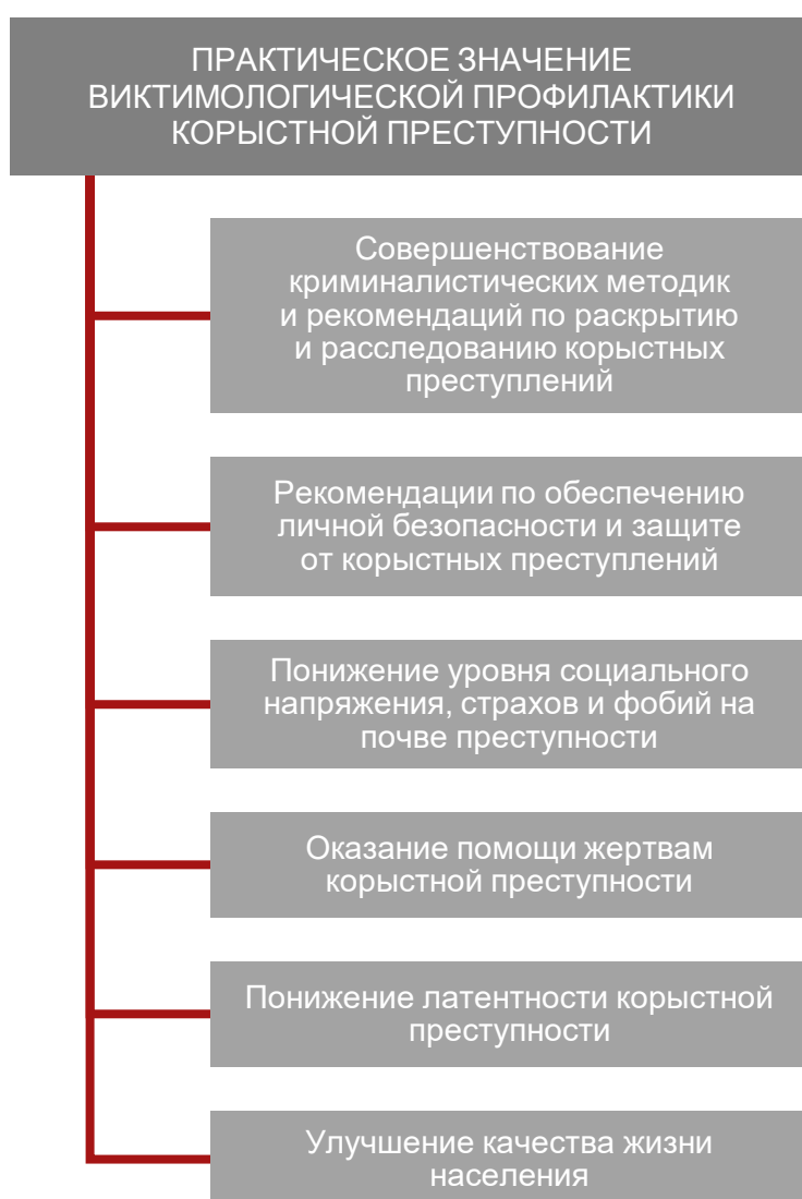
Схема 3. Практическое значение виктимологической профилактики корыстной преступности

Значение исследований и практических мер в области виктимологической профилактики представлены на схеме 3.