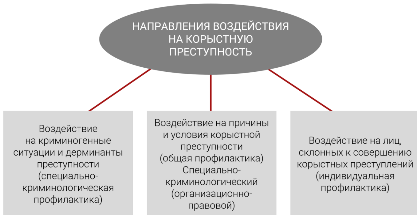
Схема 2. Направления воздействия на корыстную преступность

Обеспечение баланса между уровнем притязаний и социальным контролем возможно: