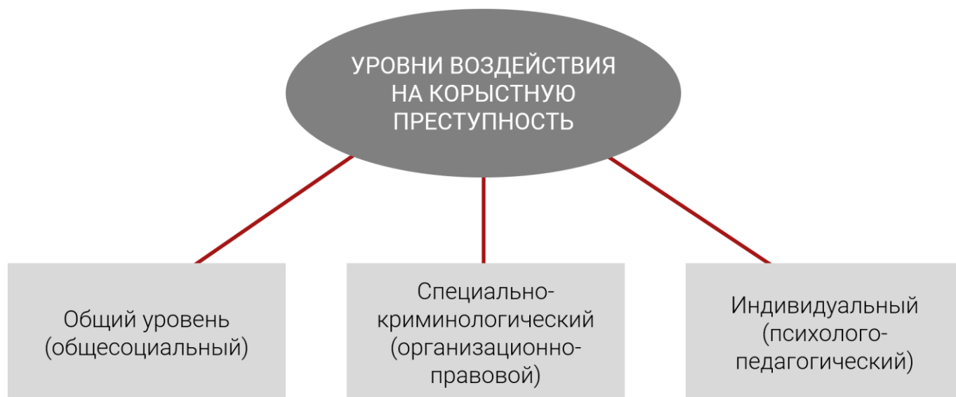
Схема 1. Уровни воздействия на корыстную преступность

Воздействие на корыстную преступность – сложная и многоплановая задача. Как целенаправленная социальная деятельность (практика) воздействие на корыстную преступность осуществляется на трех уровнях: 1) общий уровень (общесоциальный), 2) специально-криминологический (организационно-правовой), 3) индивидуальный (психолого-педагогический).