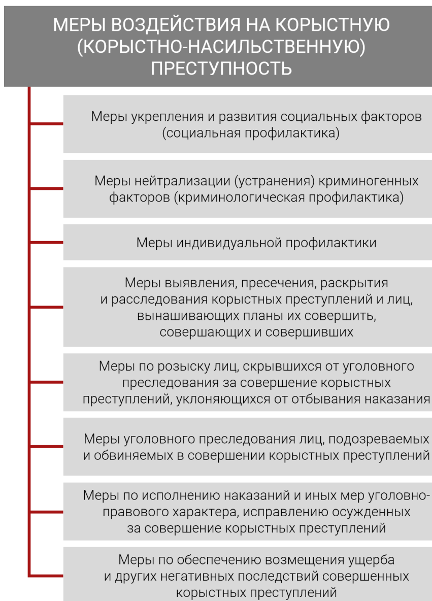
Схема 3. Меры воздействия на корыстную преступность

Содержание общесоциальных мер профилактики корыстной преступности состоит в реализации укрепляющих и развивающих антикриминогенные факторы мероприятий, обеспечении защиты приоритетов охраны национальной безопасности Российской Федерации.