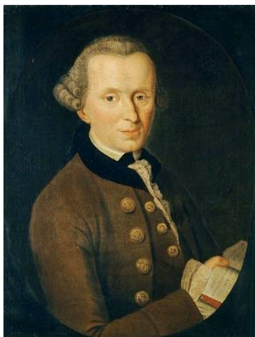
Иммануил Кант (1724–1804)

самообладание, выдержка в определенных ситуациях помогают сохранить способность прогнозировать развитие событий и своим атипичным для жертвы поведением нейтрализовать криминогенную ситуацию, сломать механизм индивидуального поведения. Нередко это выходит интуитивно.