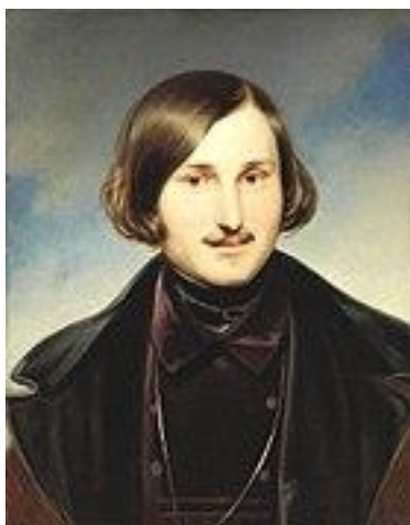
Николай Васильевич Гоголь (1809–1852)

Следует отметить, что то, что в XX веке было определено как «виктимные свойства личности», было известно с давних пор. Было подмечено, что некоторые люди обнаруживают странную способность чаще, чем другие оказываться в неблагоприятных для них обстоятельствах, становиться жертвами нападений, насилия, краж и других преступлений. Прежде всего эти факты получили признание в литературе, подмеченные зорким глазом писателей. Примером может служить повесть Н. В. Гоголя «Шинель». Она изучается в 8 классе средней школы. Однако содержание этой повести поучительно и с виктимологической точки зрения.