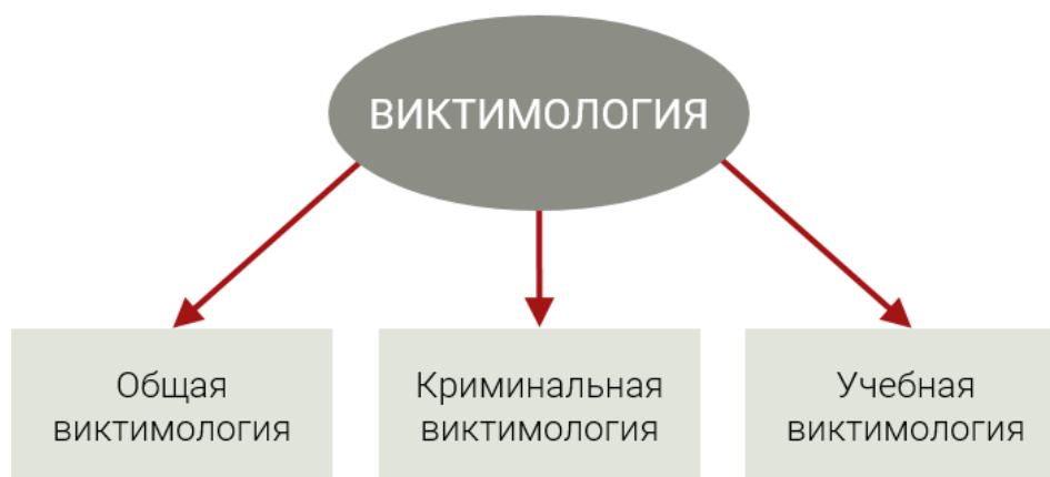
Схема 1. Понятие виктимологии

Общая виктимология – раздел науки обеспечения безопасности жизнедеятельности человека. Иногда в нее включаются исследования криминальных жертв (криминальная виктимология), но основным является изучение проблем безопасности человека при катастрофах, чрезвычайных ситуациях и стихийных бедствиях.