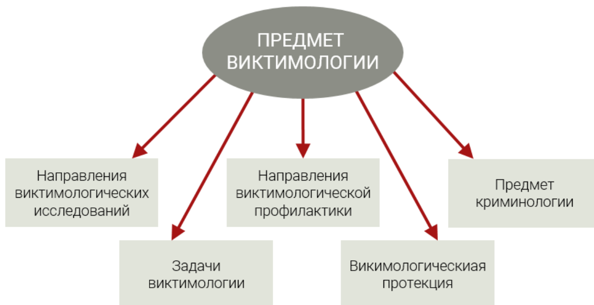
Схема 1. Предмет виктимологии