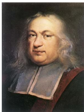
Пьер Ферма (1601–1665)

Таким образом, одним из слабых в научном отношении мест правового подхода к анализу преступности является сведение преступности к совокупной массе случайных событий.