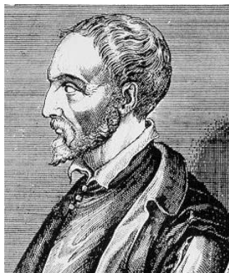
Джероламо Кардано (1501–1576)