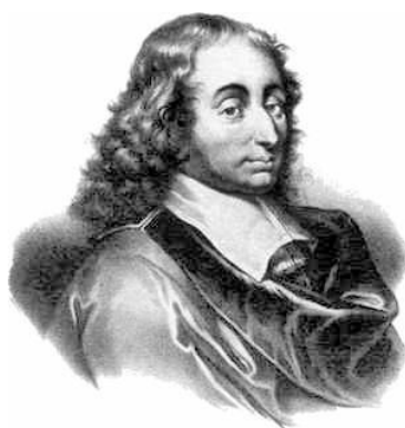
Блез Паскаль (1623–1662)