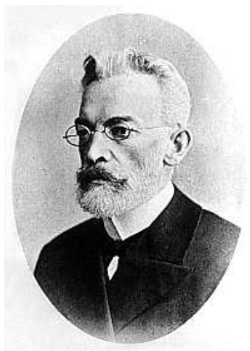
Иван Яковлевич Фойницкий (1847–1913)

Созвучные мысли мы находим у И. Я. Фойницкого (1847–1913), который в статье «Влияние времени года на распределение преступлений» обосновывает криминологическую, по сути, теорию факторов преступности. «Преступление, – приходит к выводу И. Я. Фойницкий, – определяется совместным действием условий физических, общественных и индивидуальных» 4 .