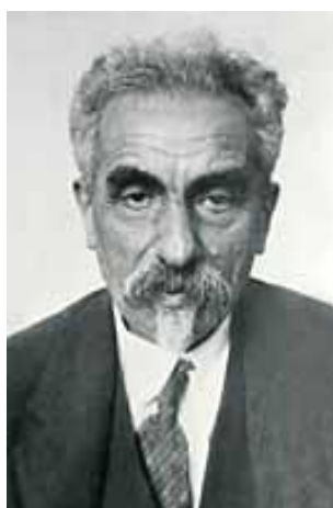
Николай Яковлевич Марр (1864–1934)

Примером квазинаук могут служить арийская физика в нацистской Германии, советское право в СССР, языкознание Н. Я. Марра, советская антиплитная геология, марксистско-ленинская геология фиксизма и др.