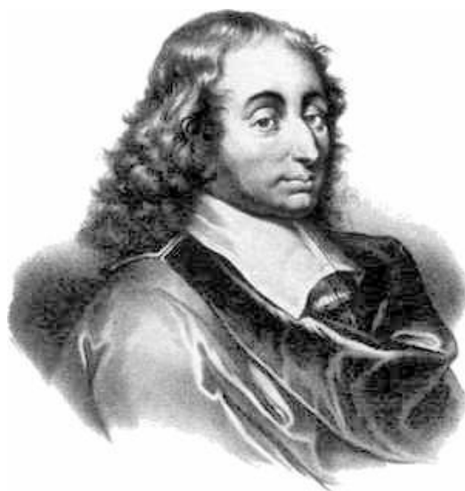
Блез Паскаль (1623–1662)

Криминология, которая сводит преступность к совокупному продукту всей массы преступлений, не является, а всего лишь объявляется наукой. Как метод решения проблемы преступности такая криминология мало для чего годится. По сути, этот метод решения проблемы преступности ставит социальное явление (преступность) в зависимость от множества случайных событий (совершения преступлений), а потому опирается на донаучные представления о тех законах, которым подчиняются подобного рода случайные события, которые перестали быть тайной для большой науки уже в XVII в., благодаря великому французскому математику Блезу Паскалю.