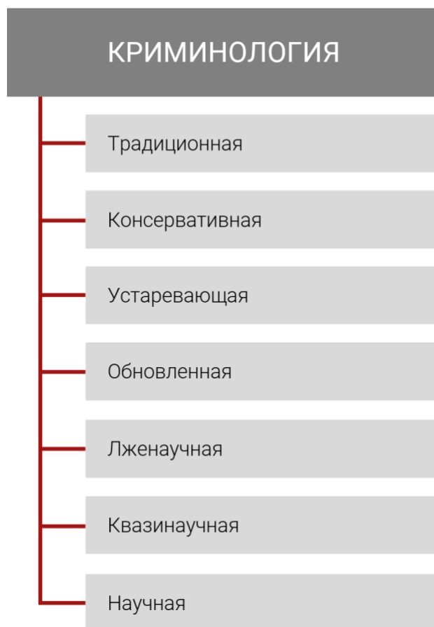
Схема 1. Виды криминологии

Рассматривая криминологию как представления о преступности и преступлениях, следует говорить не только о криминологии, но и о криминологиях. Поскольку такие представления могут быть разными, разной может быть и криминология. Так, Г. А. Аванесов подразделяет криминологию на несколько криминологий – традиционную, консервативную, устаревающую, обновленную 10 . На наш взгляд, можно также выделить научную, квазинаучную и лженаучную криминологии. Каждая из них проявляется в контенте учебной дисциплины по курсу криминологии. Учебная дисциплина должна помогать учащимся объективно оценивать и критически относиться к тем представлениям, которые предлагаются каждой из таких криминологий.