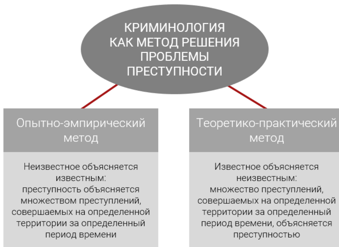
Схема 1. Криминология как метод

Суть криминологии, которая представляет собой другой, теоретико-практический метод , состоит в том, что, в противоположность опытно-эмпирическому методу, множество преступлений объясняется природой преступности как социально-правового явления. Это позволяет рассчитывать решить проблему преступности не на основе законов причинности и законов теории вероятностей, а на основе тех законов, которыми преступность описывается и подчиняется. Эти законы известны как законы истории и общества. Известным для теоретико-практического метода решения проблемы преступности является не преступность, а множество преступлений. Тогда как неизвестным при данном методе оказывается сама преступность, т. е. связь множества случайных событий с преступностью как с неотменяемым законом превращения случайного события преступности в неслучайное. Тем самым преступность предстает перед исследователем как социальное явление, как проблема, требующая познания с применением научного метода.