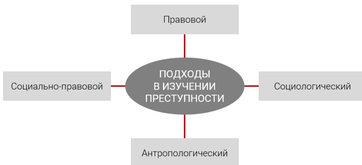
Рис. 1. Подходы в изучении преступности

Все подходы в изучении преступности условно можно подразделить на традиционные (уголовно-правовой, или криминологический «классицизм») и нетрадиционные (социологический; социолого-правовой, антропологический; теологический и др.).