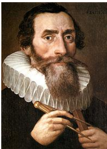
Иоганн Кеплер (1571–1630)

Еще более определенно о науке высказывался И. Кеплер, который полагал, что «геометрия существовала прежде Творения. Она так же вечна, как Божественный промысел. Геометрия дала Богу модель для Творения. Геометрия – это сам Бог 2 ». Таким образом, геометрию Кеплер связывает не с людьми и человеческим разумом, а с геометрией, наукой, которая «существовала прежде Творения».