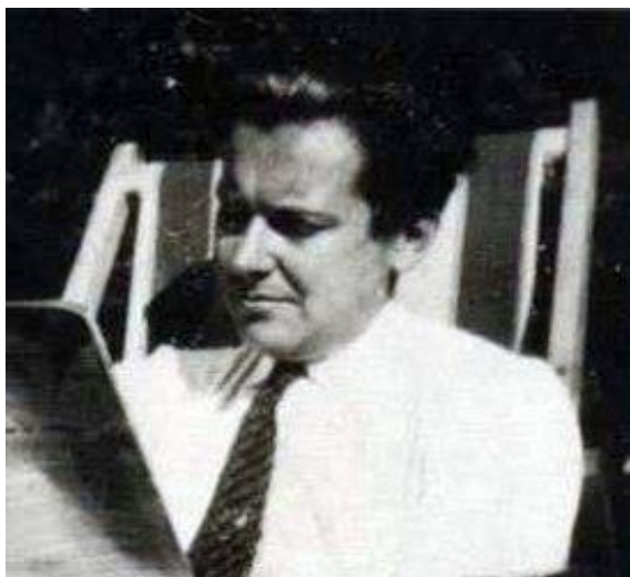
Карл Людвиг фон Бергаланфи (1901–1972)

(система). Любой фрагмент действительности может быть рассмотрен как часть большой системы, а следовательно, как система. Это свойство объективного мира легло в основу системного подхода. Основателем общей теории систем является австрийский ученый Карл Людвиг фон Бергаланфи.