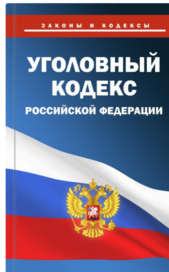
Статья 226.1 УК РФ