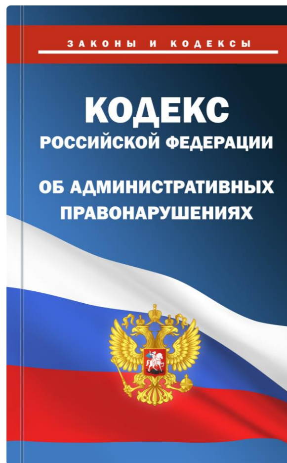
Статья 16.2 КоАП РФ